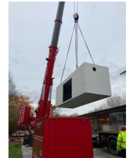
Anlieferung der Pelletheizungs - Container per Kran