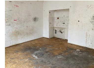
Zunftstraße 16 – Messi-Wohnung wird z.Zt. komplett Instandgesetzt und Saniert.