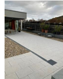
Vorher – Dachterrassenbelag - nachher