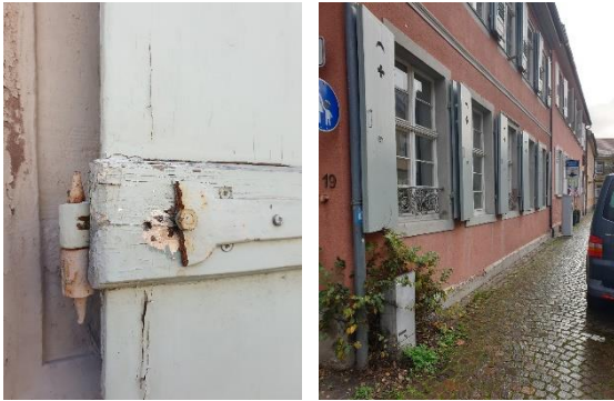
Amthausstraße 19 - Instandsetzung Klappläden