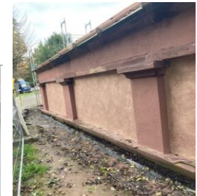
Farbfassung gem. Muster