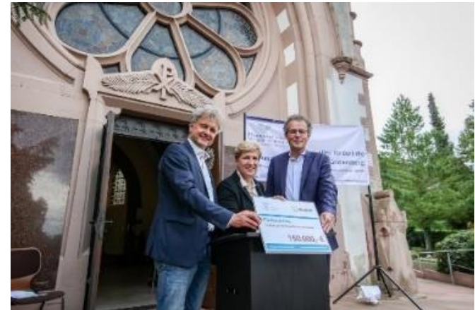
Übergabe der Fördermittel von 150.000,-€ der Denkmalstiftung (Glücksspirale) durch Frau Ministerin Razavi