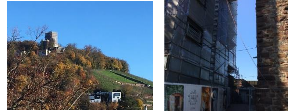
Der eingerüstete Turm mit elektrischem Aufzug

Der Turmbergturm ist seit Sommer 2022 eingerüstet und wird fortan saniert. Die Leistungen fangen bei Natur- und Tierschutz an, beinhalten hauptsächlich die komplette Überarbeitung des Natursteinmauerwerks gem. Landesdenkmalpflege und werden abschließend mit einer neuüberarbeiteten Plattform voraussichtlich Ende 2023 abgeschlossen sein. Gesamtbudget: 1.275.000,-€