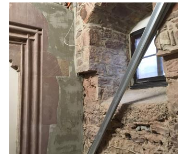
Portal und Erkerfenster im zukünftigen Schankraum