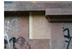
Muster nach Dr. Maag

Die Instandsetzung des Natursteindaches des Weinbrenner- Brunnenhauses wurde in 2021 abgeschlossen. In 2022 wurden nach einer restauratorischen Untersuchung durch Herrn Dr. Maag, die Fassadenelemente in Farbe gefasst. Kosten ca. 60.000,-€ die Fertigstellung ist je nach Witterung im Frühjahr 2023. Zudem wurde bereits das umliegende Gelände mit einer rundum laufenden Drainage über die Abt. Gartenbau ausgeführt, die Fertigstellung der Außenanlage ist auch für Frühjahr 2023 geplant. Im Sommer 2023 erfolgt dann die Innenausstattung (Kneippkur)