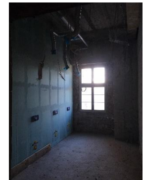
Rohbau mit Installationswand