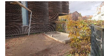
Fundamentplatte für Außenlager