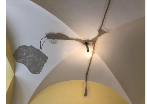
Container für Bibliotheksauslagerung und Aufbrüche im Gewölbe